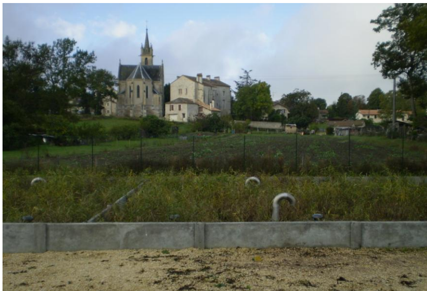
Bouniagues vue depuis la station d'épuration

Le premier concerne notre réseau d'assainissement collectif, ainsi que la station de traitement des eaux usées. A ce jour 153 foyers ont la possibilité de se raccorder, évitant ainsi la remise en conformité de leur filière d'assainissement, obligatoire et coûteuse. Ce réseau va permettre aussi l'urbanisation de nouvelles parcelles de terrain, permettant ainsi un développement plus respectueux de l'environnement.