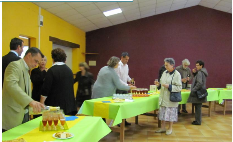
Enfin on s'approche du buffet !