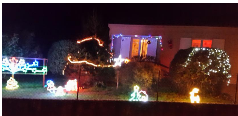
Une des quatre maisons ayant gagné le premier prix