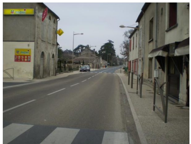
Réfection des trottoirs