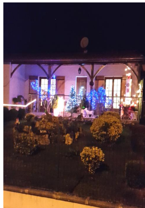
Une maison décorée