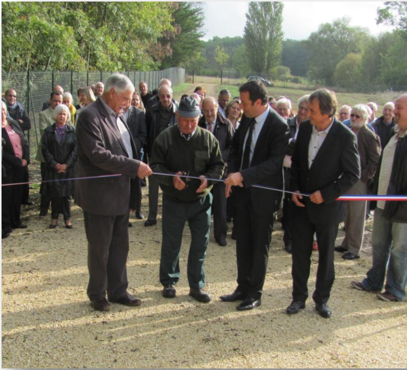
Inauguration de la station d'épuration