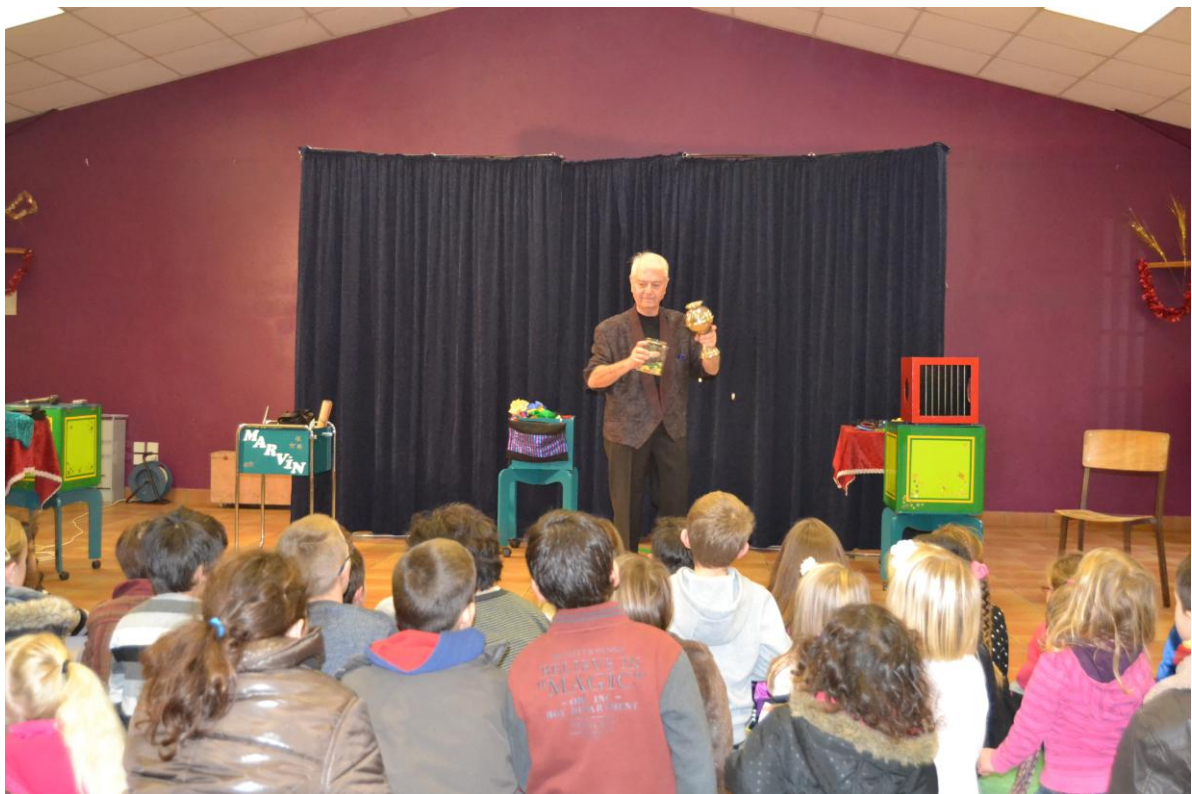
Les enfants sont fascinés par le magicien