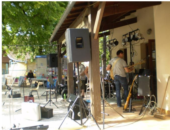
Les musiciens s'installent pour animer le marché gourmand.