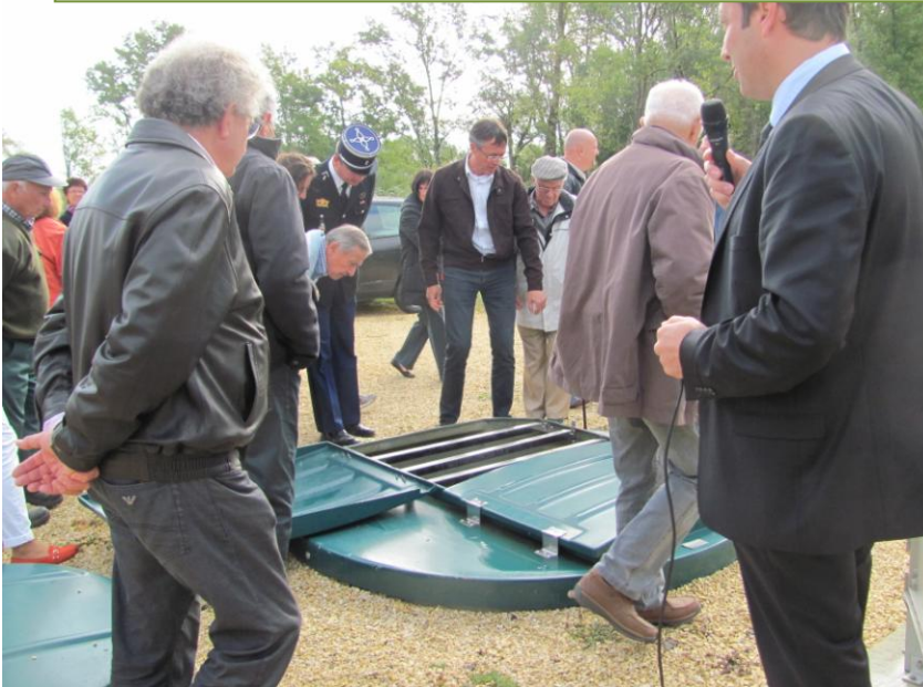
Visualisation des pompes