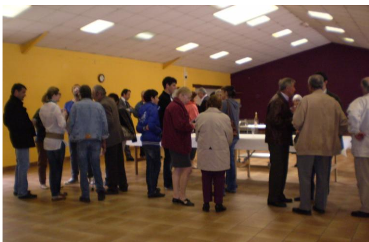
On discute autour du verre de l'amitié

La présente délibération est reconduite de plein droit annuellement. Les taux et exonérations fixés ci-dessus pourront être modifiés tous les ans.