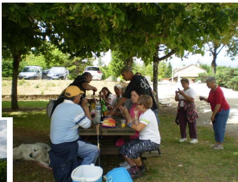
Les randonneurs se restaurent