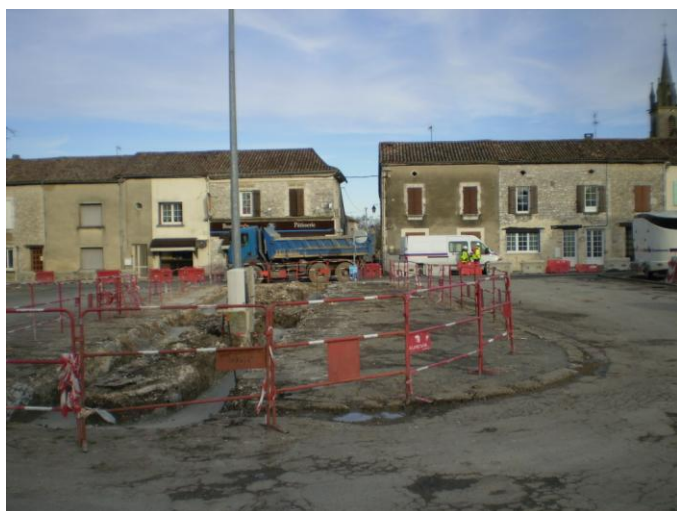
La place de la Poste en travaux.....

La déchèterie de Bergerac est ouverte du lundi au dimanche : de 8h à 12h et de 14h à 19h en été ; Et de : 8 h à 12h et de 14h à 18h en hiver.