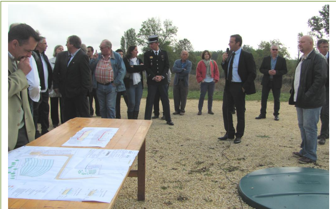
Explication du fonctionnement de la station d'épuration.