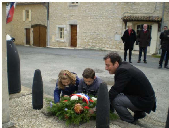
Dépôt de gerbe en commémoration du 11 novembre 1945