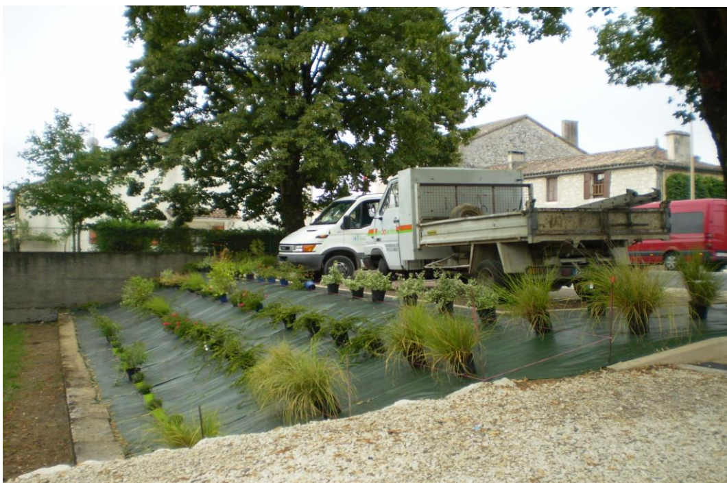
Plantation du talus devant la salle des fêtes