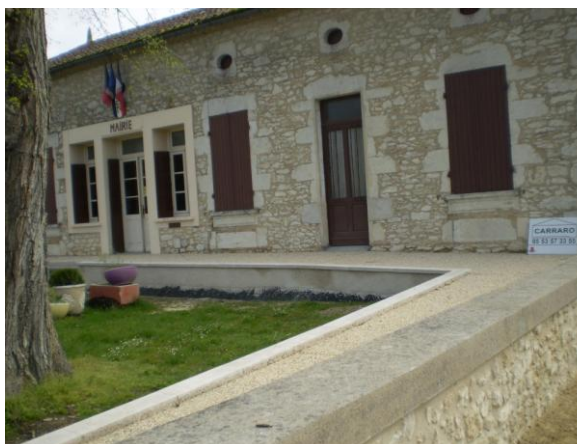
Mise en place de la rampe d'accès à la mairie