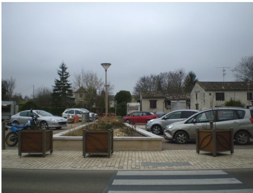
Place de la poste