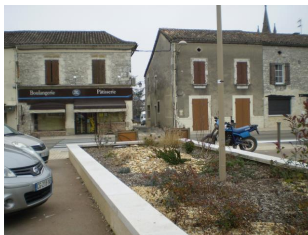
Et .....après les travaux !